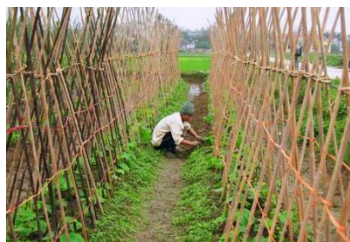
Giàn chữ X